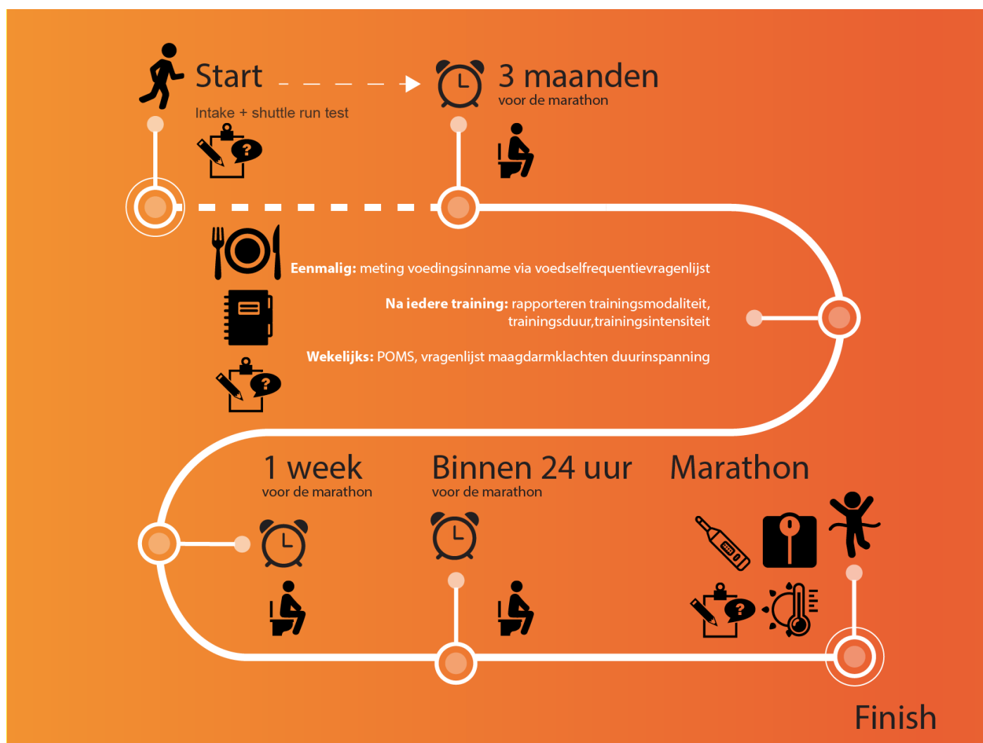
Tijdspad en protocol van de studie.